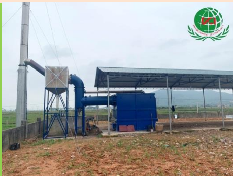
VẬN HÀNH LÒ ĐỐT RÁC SINH HOẠT