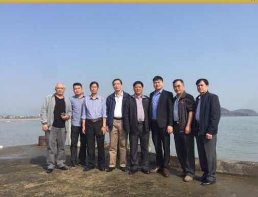
ĐOÀN CÔNG TÁC TẠI ĐÀ NẴNG