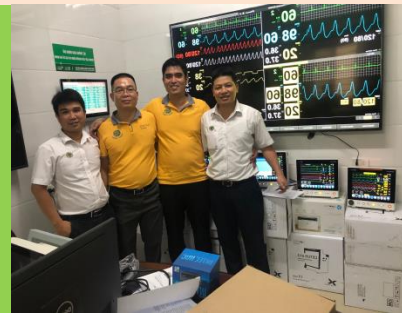
CHUYÊN GIAO CÔNG NGHỆ