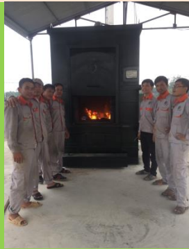
LÒ ĐỐT CÔNG SUẤT 500-700 KG/H