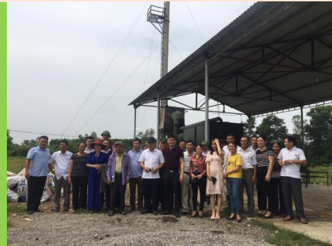
ĐOÀN THAM QUAN TẠI XÃ MINH THÀNH