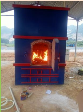
LÒ ĐỐT RÁC THẢI Y TẾ