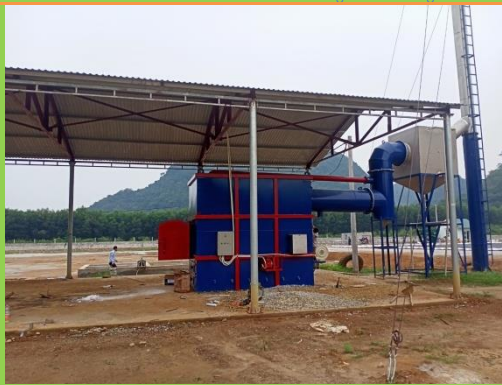
LẮP ĐẶT LÒ ĐỐT RÁC TẠI CƠ SỞ Y TẾ