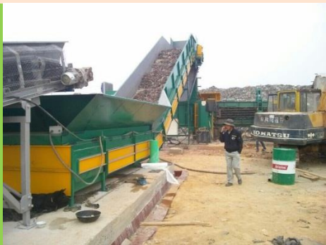
MÁY PHÂN LOẠI RÁC THẢI SH