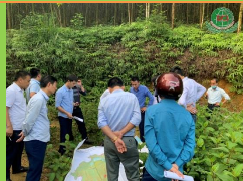
KHẢO SÁT LẬP DỰ ÁN TẠI TỈNH HÀ TĨNH