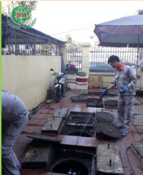
HỆ THỐNG XỬ LÝ NƯỚC THẢI