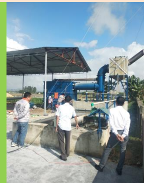
LÒ ĐỐT DCI-500 LẮP ĐẶT TẠI YÊN THÀNH