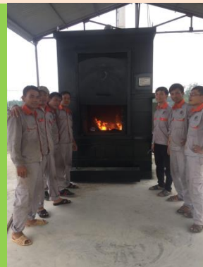
LẮP ĐẶT, HOÀN THÀNH BÀN GIAO LÒ DCI